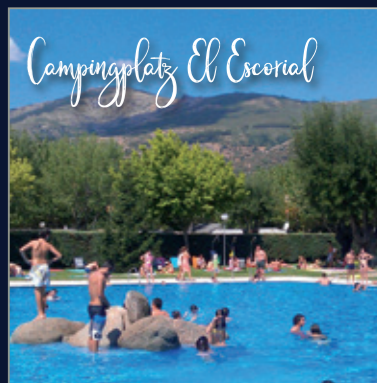
Campingplatz El Escorial